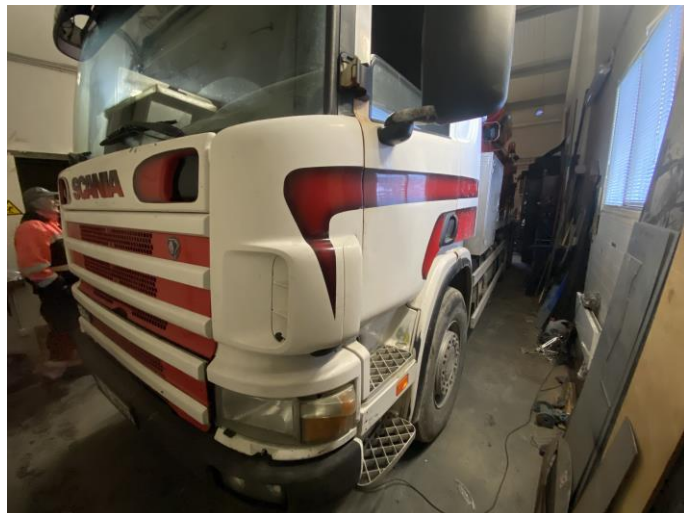
Attēls Nr. 2