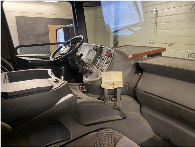
Attēls Nr. 19