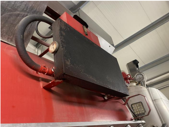
Attēls Nr. 15