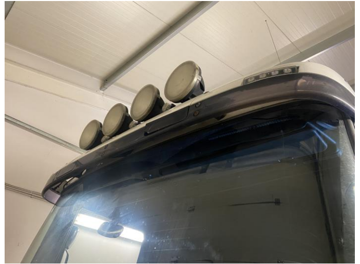
Attēls Nr. 8