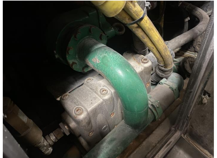
Attēls Nr. 14