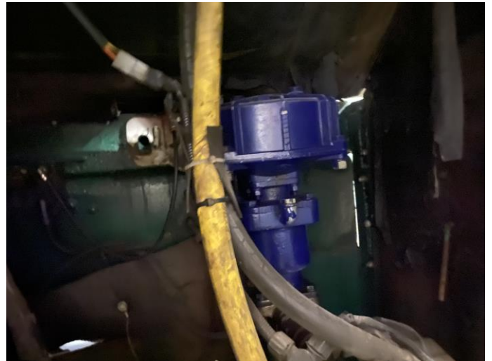
Attēls Nr. 16