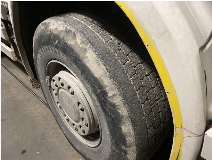
Attēls Nr. 11