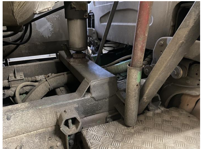
Attēls Nr. 12