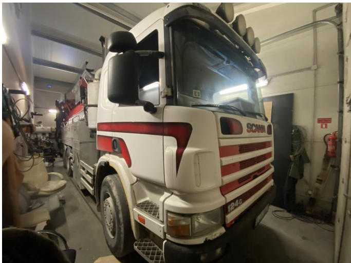
Attēls Nr. 1