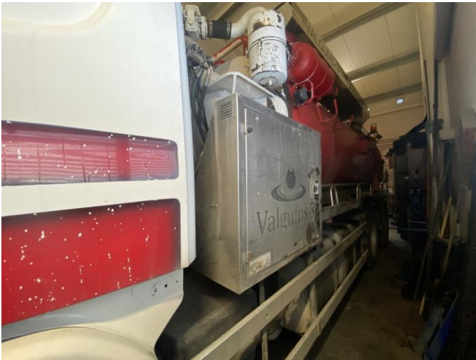
Attēls Nr. 9