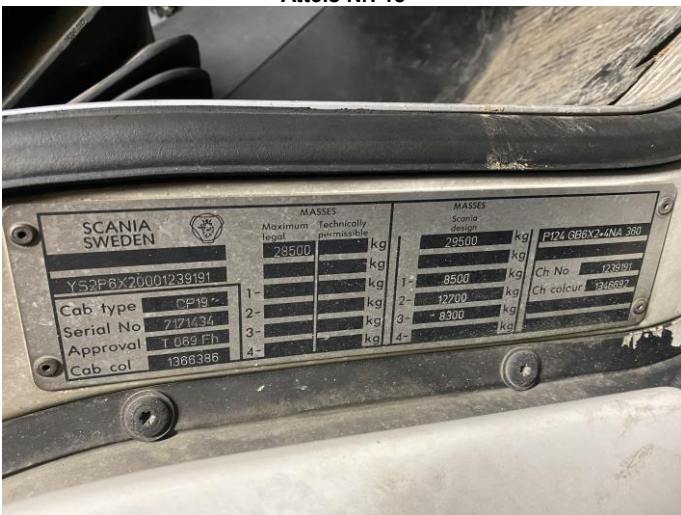
Attēls Nr. 17