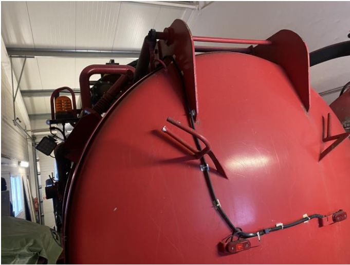
Attēls Nr. 7