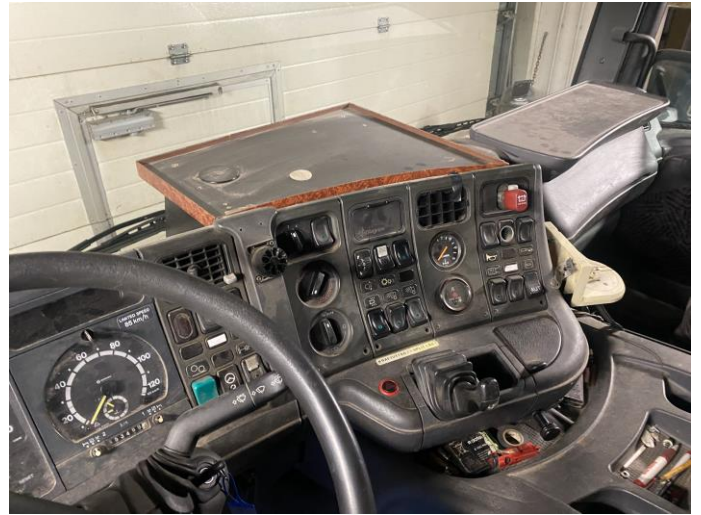
Attēls Nr. 20