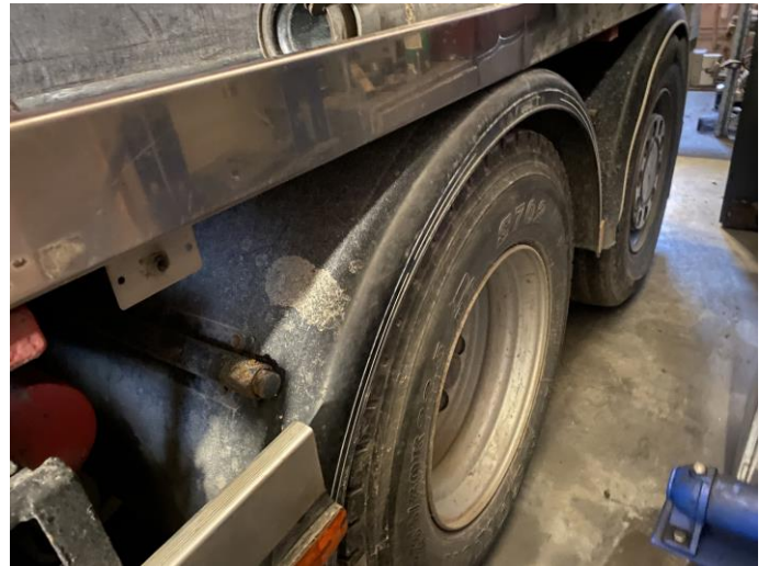
Attēls Nr. 10