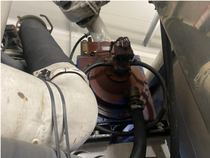
Attēls Nr. 13