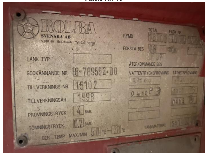
Attēls Nr. 18