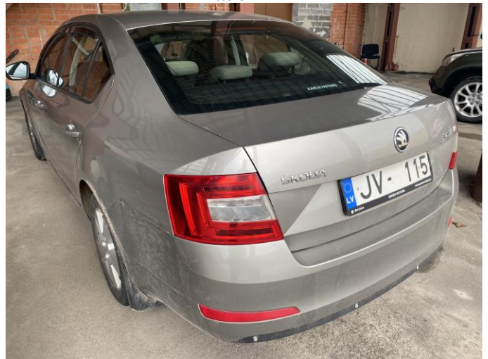
Attēls Nr. 4