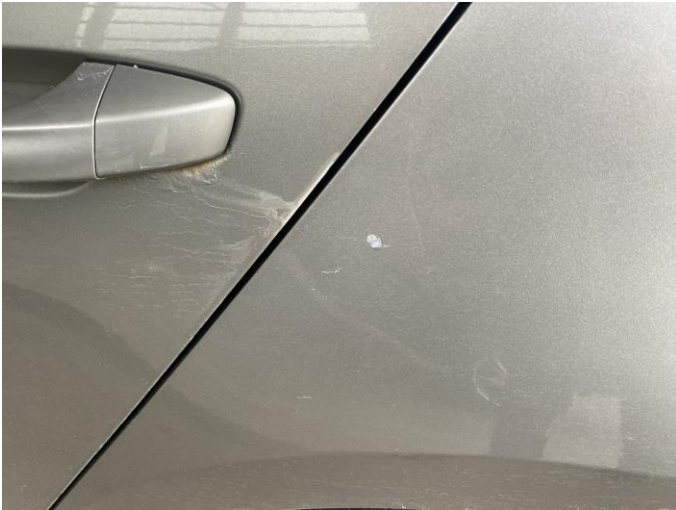
Attēls Nr. 7