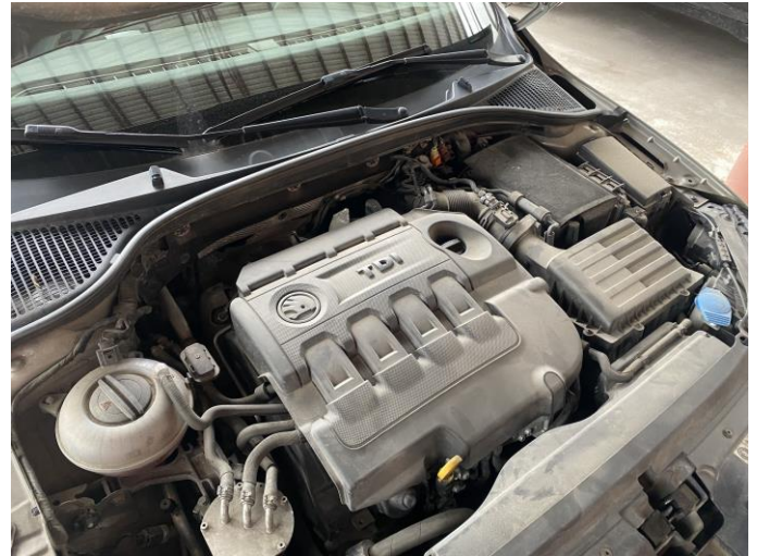
Attēls Nr. 16