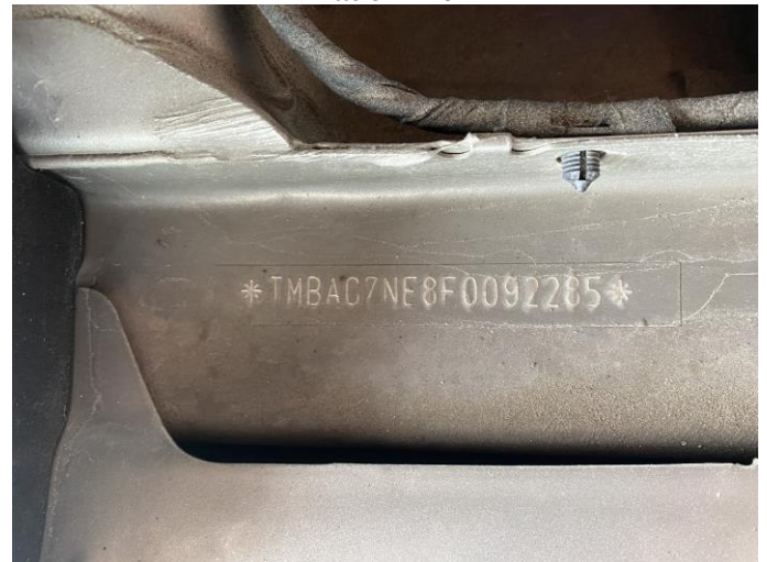
Attēls Nr. 22