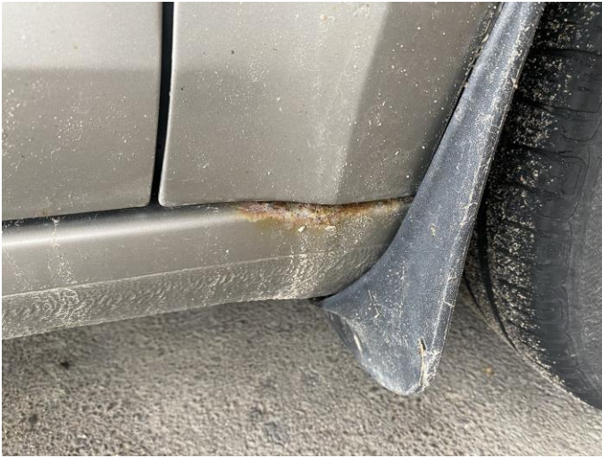
Attēls Nr. 13