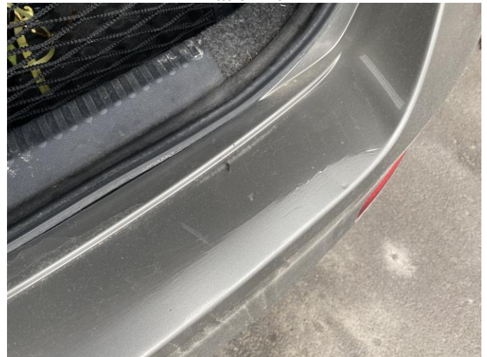
Attēls Nr. 10