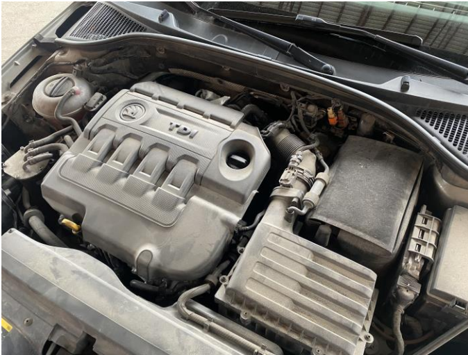
Attēls Nr. 15