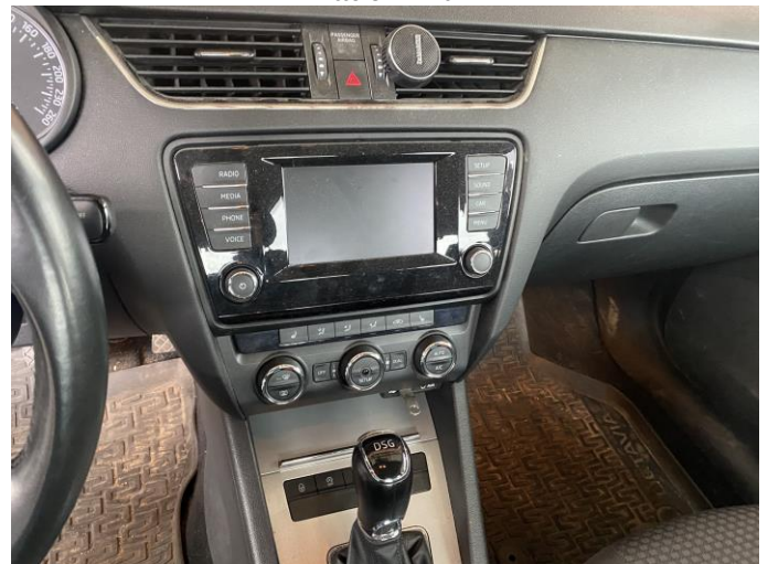
Attēls Nr. 18