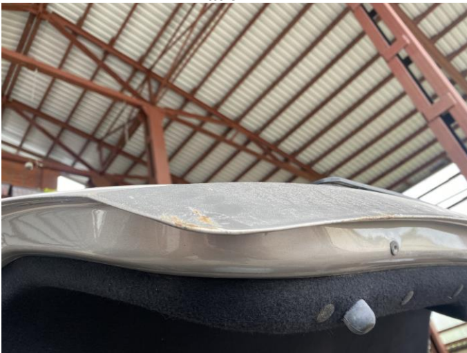
Attēls Nr. 9