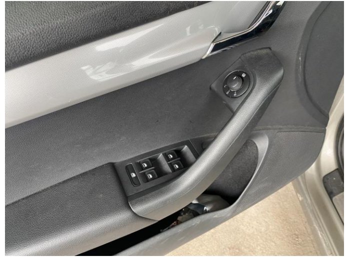
Attēls Nr. 14