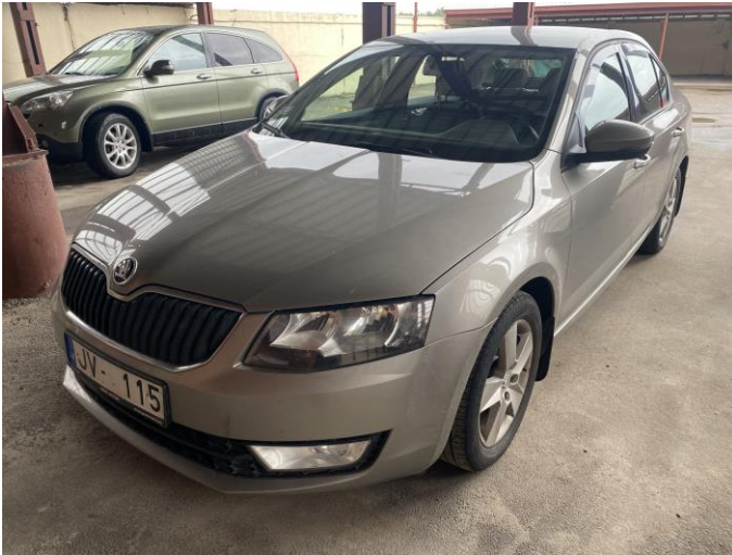
Attēls Nr. 1