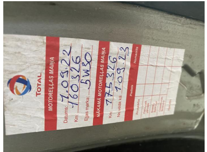
Attēls Nr. 20