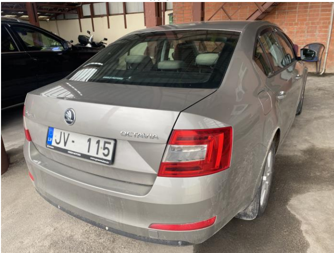
Attēls Nr. 3