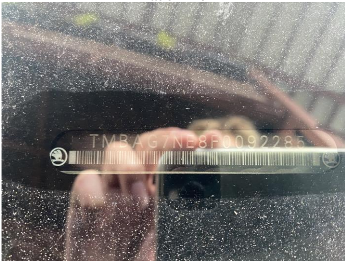
Attēls Nr. 21