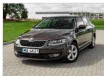
Skoda Octavia 7590 €