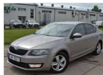
Skoda Octavia 6950 €