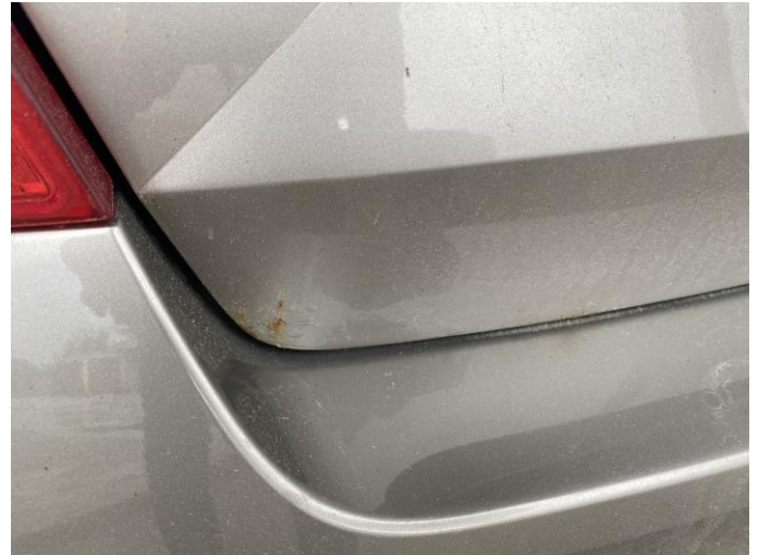
Attēls Nr. 8