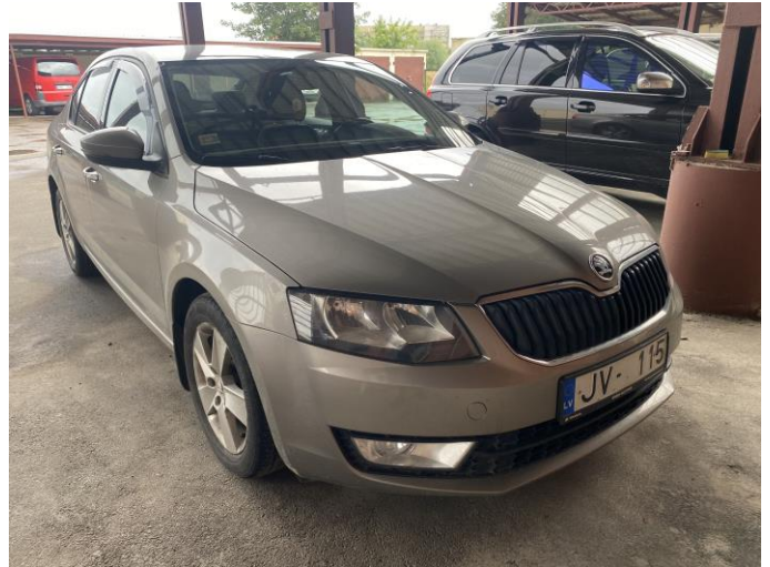
Attēls Nr. 2