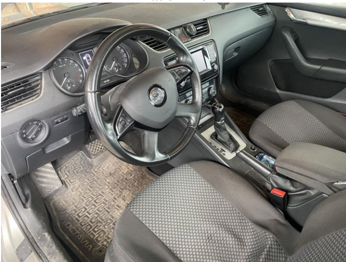
Attēls Nr. 17