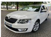
Skoda Octavia 7950 €